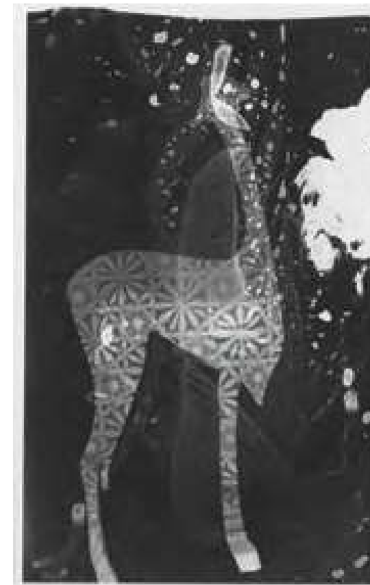
PROYECTO FOTográfico VERTE MIRARTE