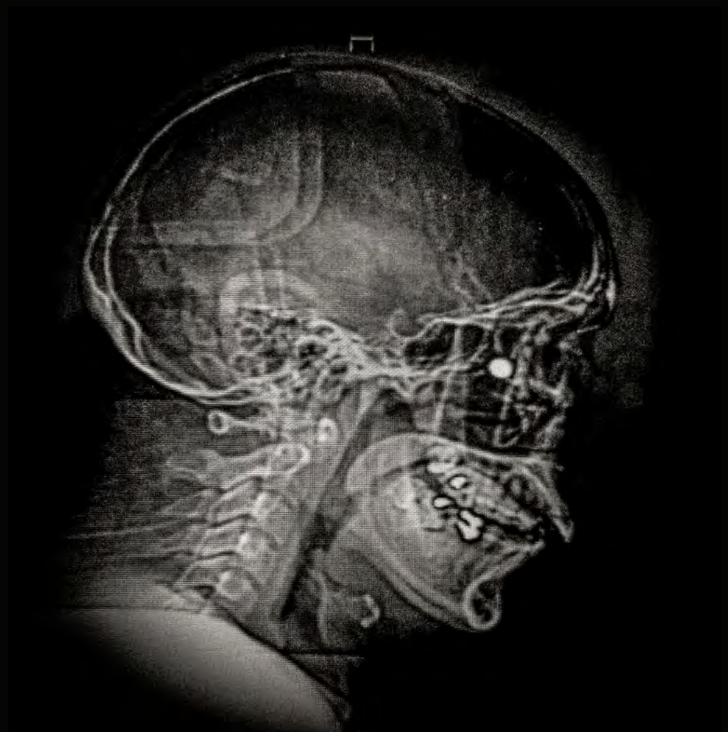
Radiografías de personas heridas que muestran la bola de goma de 8 mm incrustada en la cavidad ocular de los manifestantes. Santiago, Chile.