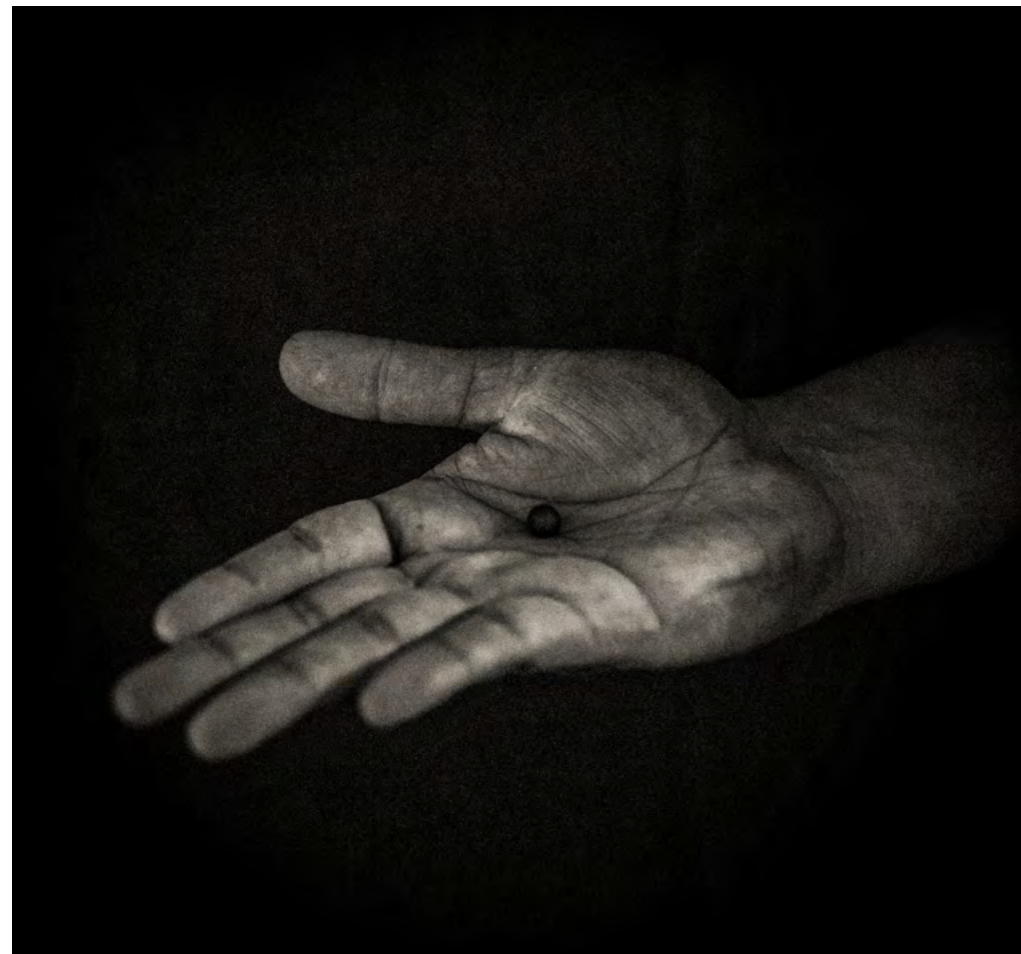
Balín de 8 mm, calibre 12 mm. Composición de 20 % caucho, 80 % sílice, sulfato de bario y plomo. La dureza del perdigón es de 96,5 Shore A, unidad de medida cuya escala máxima es 100. El 70% de los pacientes con trauma ocular, del 18 de octubre al 30 de noviembre de 2019, presentaron lesiones producidas por balines antidisturbios. Fuente: Facultad de Ciencias Físicas y Matemáticas de la Universidad de Chile (Nov. 2019), Eye Magazine (Nature) y Universidad de Chile.