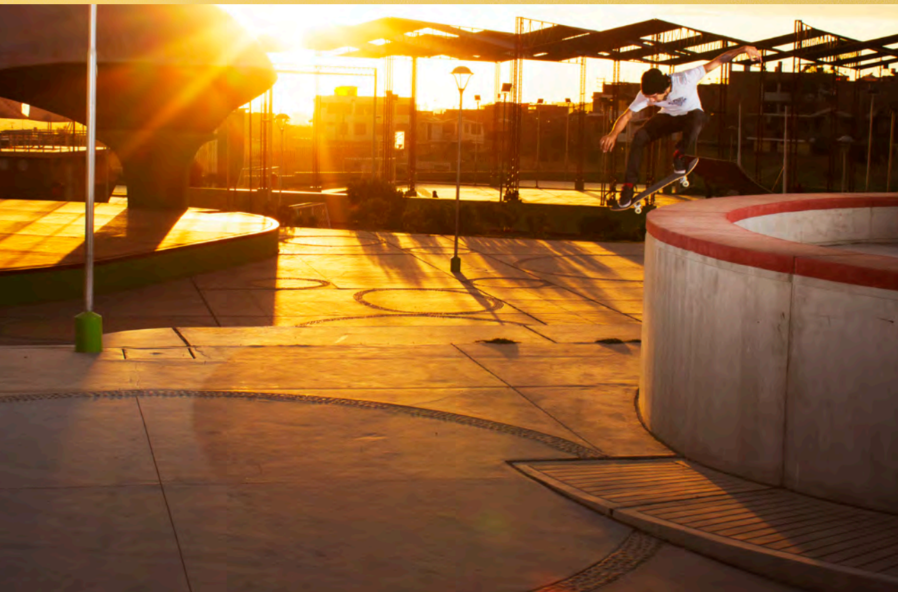
Remo Quincot / Nosebonk / Arequipa