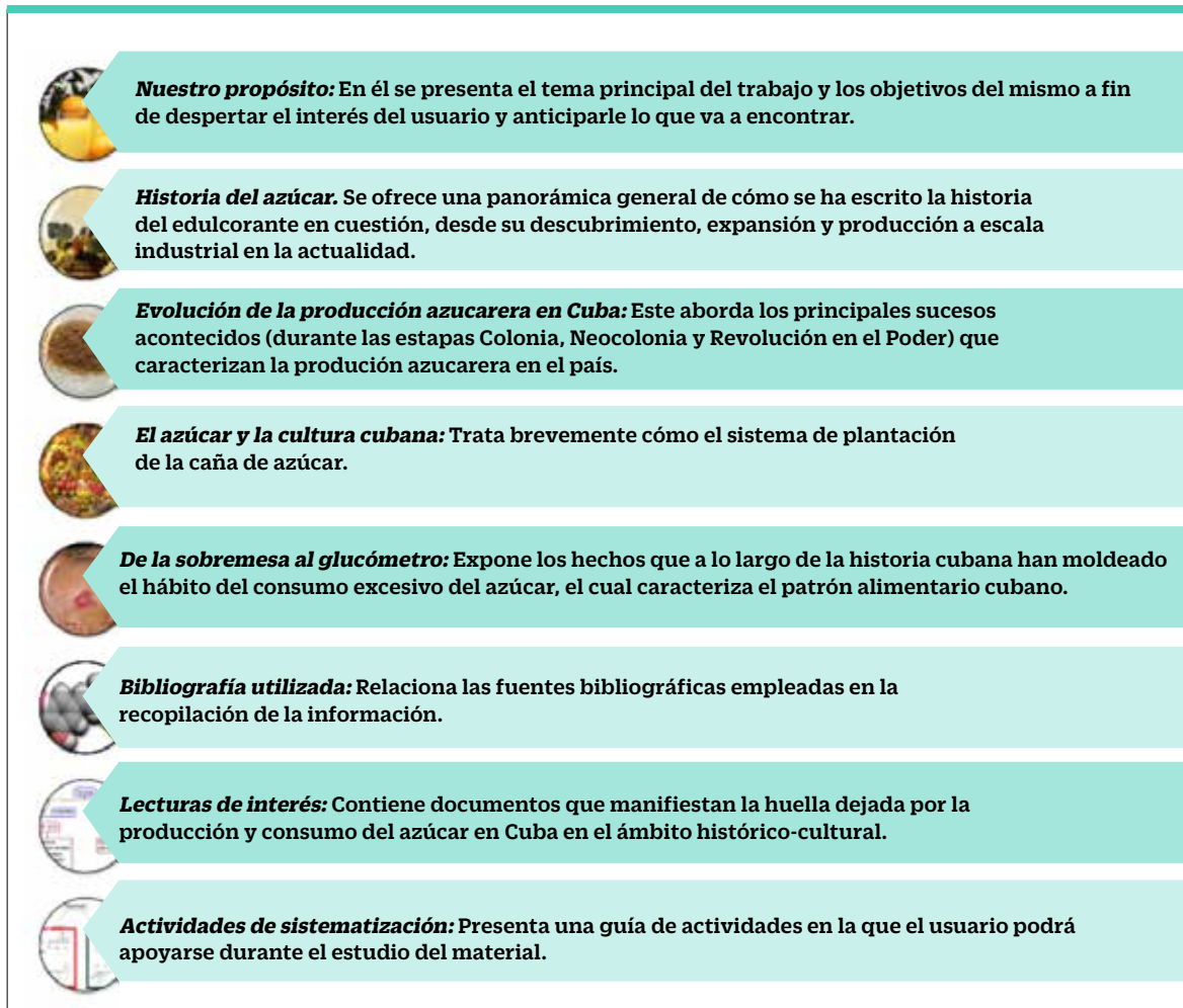
Figura 5. Lista de nodos tratados en la monografía.