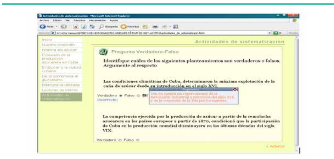
Figura 6. Ejemplo de interfaz correspondiente al material monográfico "Impactos de la producción de azúcar en Cuba: de la sobremesa al glucómetro", visualizado desde la intranet de la universidad.