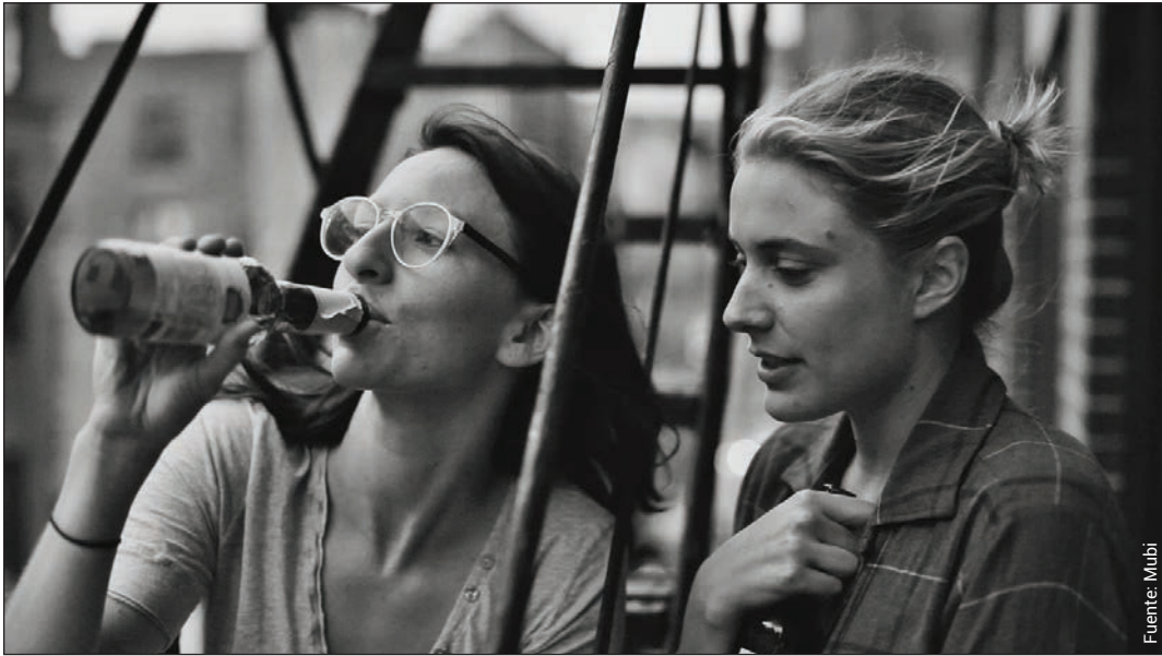
Frances Ha (Noah Baumbach, 2012).

Rosalinah et al. (2022) definen el feminismo como la idea de que los hombres y las mujeres son creados iguales, poseen los mismos derechos y merecen igualdad de oportunidades. La ideología aspira a que las mujeres estén libres de roles de género opresivos en vez de formar la imagen ideal de mujer que la sociedad quiere: casarse y convertirse en ama de casa. El discurso sobre el género, la resistencia y la reivindicación se enfoca en oponerse a la opresión. Según Tong (2009, citado en Fatsamari & Kanafillah, 2021), este movimiento presenta una tendencia que consiste en ir en contra de la hegemonía del sistema social patriarcal.