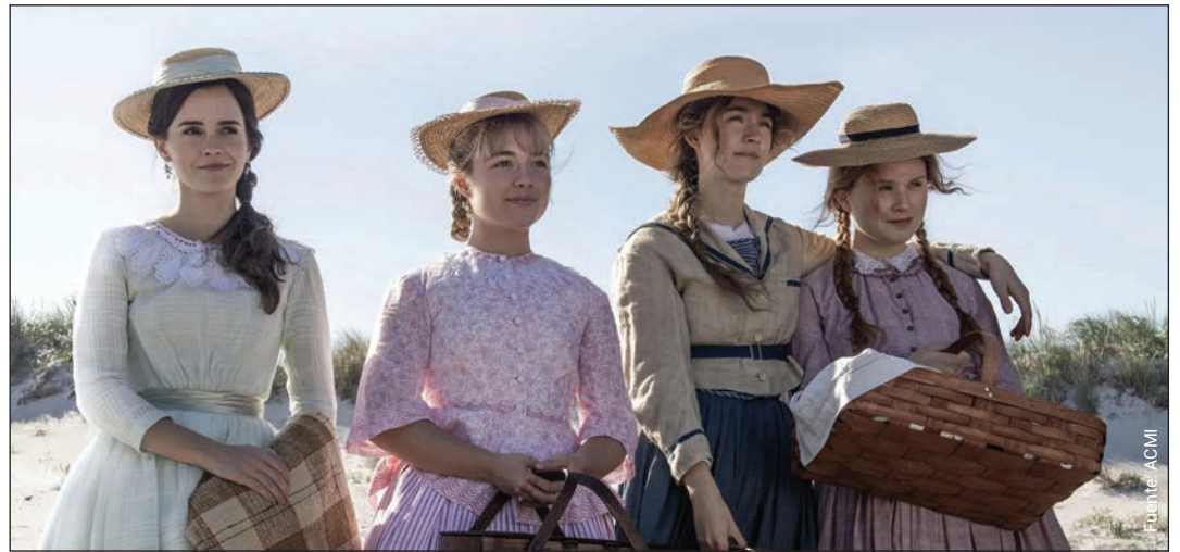
Little women (Greta Gerwig, 2019).

típicos de la adolescencia, así como las dificultades de la familia, la amistad, el amor y la identidad. Uno de los aspectos más destacados de su autodesarrollo es la determinación de formar su propio camino. A pesar de las expectativas y presiones de su madre, su escuela y su sociedad, Christine se mantiene fiel a sí misma y a sus sueños. En una escena simbólica, rechaza la institución educativa preferida de su madre y decide estudiar en California, una decisión que representa su deseo de autenticidad y autodesarrollo (Fatsamari & Kanafillah, 2021).