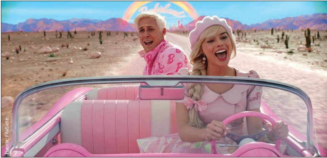
Barbie (Greta Gerwig, 2023).

diferencias respecto a las otras Barbies utilizando unas sandalias planas. La diferenciación es importante en la búsqueda de la identidad de las mujeres: buscan diferenciarse de su entorno, pero también de los hombres, aunque tienen influencia de ambos.