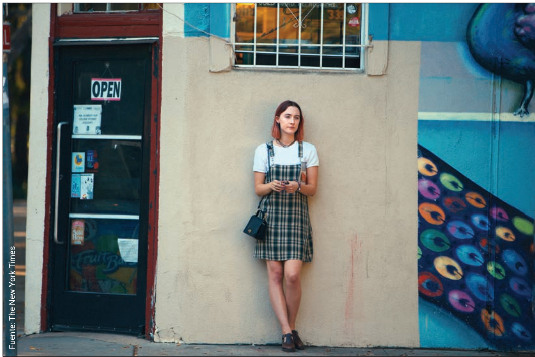
Lady Bird (Greta Gerwig, 2017).

riedad, muchos jóvenes retrasan metas de vida como el matrimonio y los hijos, considerados marcadores de la edad adulta. En lugar de seguir las convenciones tradicionales, los jóvenes adultos pasan sus años de juventud y adultez temprana obteniendo una educación, comenzando una carrera, teniendo diferentes relaciones y experimentando la independencia. Este enfoque en el crecimiento personal y en la autenticidad se evidencia de manera destacada en las películas de Gerwig, donde los personajes dedican una parte significativa de su tiempo a perseguir sus propias metas y sueños antes de considerar una relación seria: