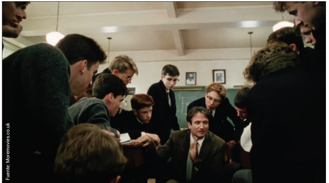
Dead poets society (Peter Weir, 1989).

Las carreras de los profesores no parecen ser coincidencia. Las artes y las humanidades tienen consecuencias importantes en los seres humanos y, en el rango de edad de los estudiantes de estas películas, son cruciales para su desarrollo emocional y conductual.