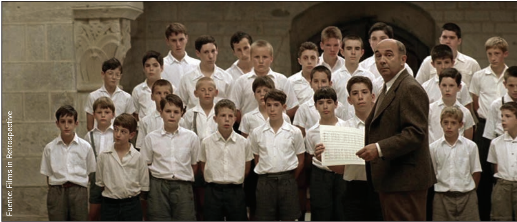
Les choristes (Christophe Barratier, 2004).

dilemas personales que enfrentan. Esto provoca que la relación inicie de manera distante y no cooperativa por parte del estudiante. Sin embargo, como se mencionó en el marco teórico, los autores evidencian que estos profesores aplican métodos de enseñanza no convencionales. Al ser profesores diferentes, los alumnos les prestan más atención, lo que beneficia a ambas partes. Los alumnos son motivados a mejorar en su vida personal y académica, encuentran sus verdaderas pasiones. Todo esto es posible gracias a que los profesores no se rinden con ellos, lo que permite que los alumnos vean ciertos cursos de manera distinta e incluso los disfruten.