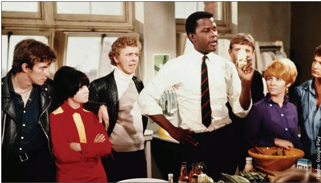
To sir, with love (James Clavell, 1967).

su manera de enseñar, lo que provoca un cambio en la relación con sus alumnos (Novoa, 2021). Algo parecido también pasa en “Dead poets society” (Weir, 1989) con hechos que ocurren en la Academia Welton, situada en Vermont, Estados Unidos, en 1959. Se aprecian los efectos de los cambios radicales de la década de 1950 en la sociedad estadounidense, años conocidos por la tradición y el conformismo. Lugo, durante la década de 1960, la sociedad experimentó injusticias y una revolución en la educación. La película aborda temas de inconformidad, libertad de elección y resistencia contra las normas impuestas en un contexto histórico de cambio y transformación social en la época que va de 1959 a 1960 (Cross, 1995).