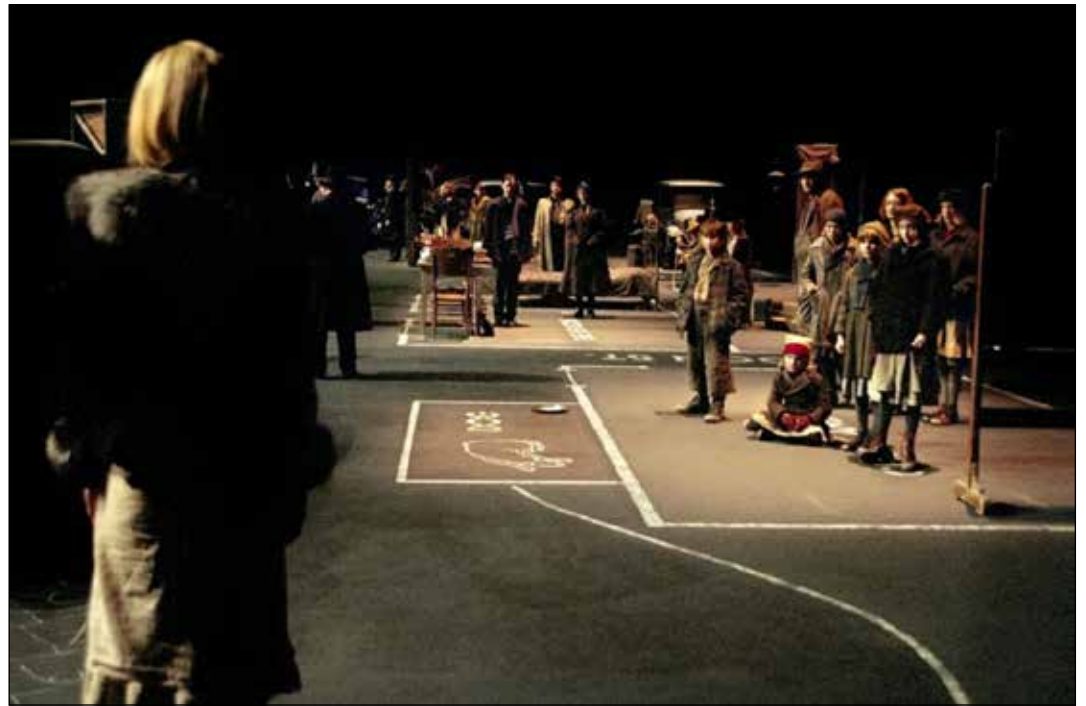
Dogville (Lars Von Trier, 2003).

Grace es una fugitiva y pide asilo. Los pobladores la acogen pero exigirán que ella les retribuya la ayuda trabajando para cada uno de ellos una hora al día. De esta manera se aprovechan de Grace y abusan de ella psicológica y sexualmente, lo que evidencia la humillación y el sufrimiento que tiene que afrontar.