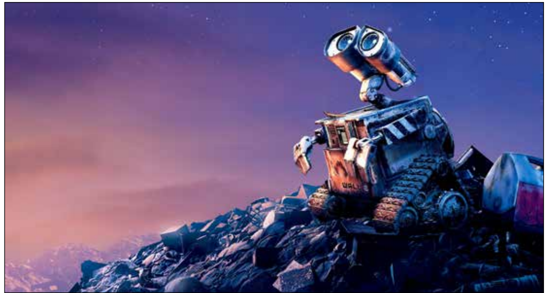
Wall-E (Andrew Stanton, 2008).

El slapstick es un tipo de comedia que muestra violencia exagerada sin consecuencias reales y buscan la risa del espectador. El creador fue Mark Sennet, quien posteriormente contratará a Chaplin para que trabaje con él en la Keystone Film Company desempeñando el papel de Charlot.