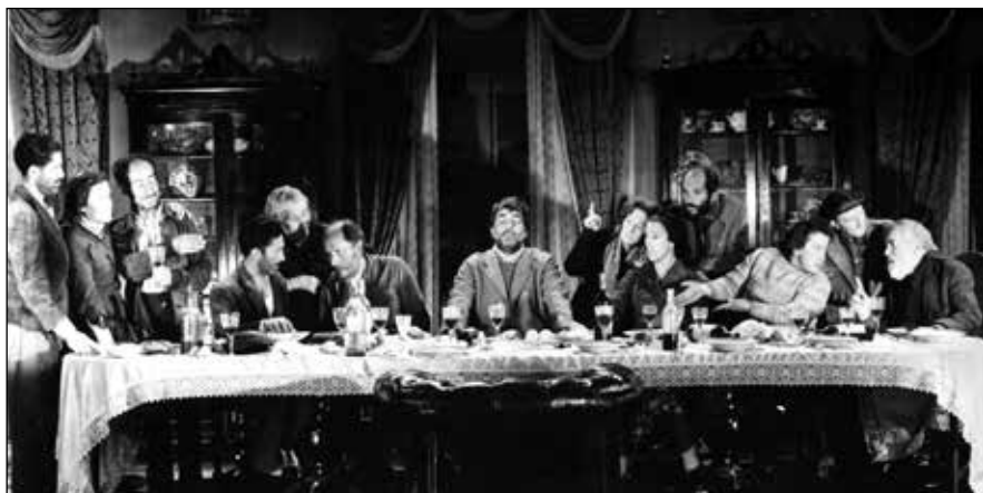
Viridiana (Luis Buñuel, 1961).

En Viridiana existen dos lados arquetípicos y Buñuel es capaz de adaptarse con una propuesta artística y simbólica a los clichés de la femineidad que están supuestos en el colectivo. Muchos de los objetos dentro de la película son símbolos, ya sea para evocar algún tema clerical u erótico. El surrealismo está inscrito en el día a día: la cruz con cuchillo, la corona de espinas quemadas, la ubre de la vaca que Viridiana no quiere ordeñar. (Yasmín Sayán)