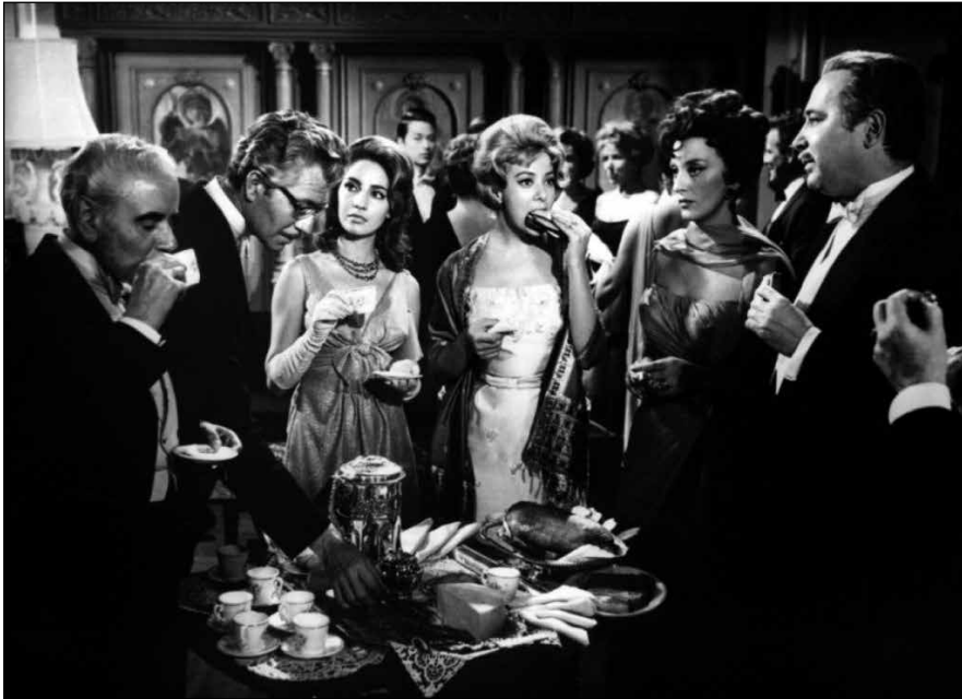
El ángel exterminador (Luis Buñuel, 1962).