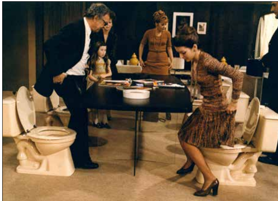
Le fantôme de la liberté (Luis Buñuel, 1965).