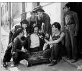
Los olvidados (Luis Buñuel, 1950).

La película asume como motor narrativo la inercia de esas intensas pulsiones adolescentes: Jaibo lidera una golpiza colectiva contra un mendigo ciego y lascivo. Luego, cobra su esperada venganza: mata a garrotazos y pedradas a su delator. Cuando su cómplice es enviado a un reformatorio, Jaibo seduce a su madre. Para rehuir a la policía, se esconde en el granero de un amigo suyo, donde intenta abusar de la hermana de su benefactor. Las infamias se multiplican sin fin. Nada, ni siquiera la candidez de Ojitos, escapa a esta espiral de oscura violencia, es decir, de deseo. Para Buñuel, eran lo mismo. (Joel Calero)