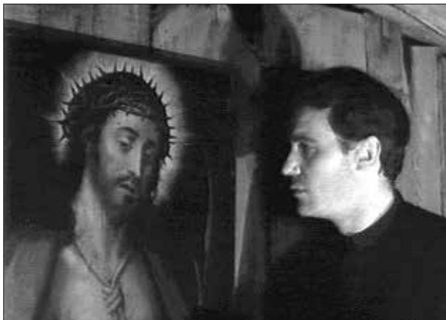
Nazarín (Luis Buñuel, 1958).