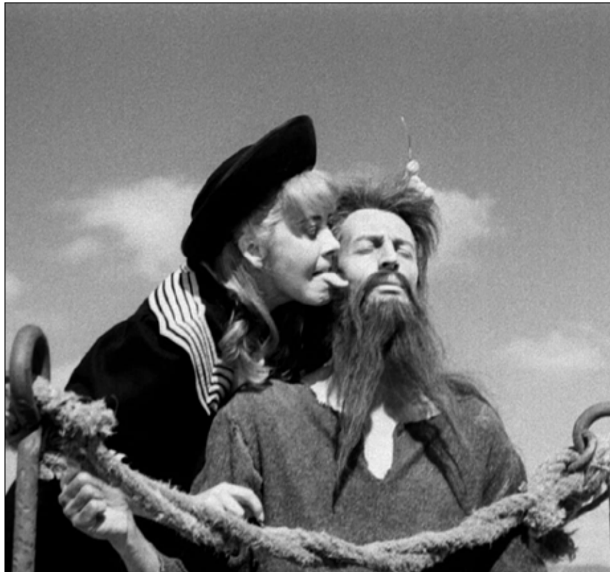
Simón del desierto (Luis Buñuel, 1965).