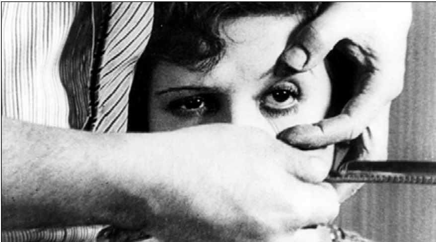
Un perro andaluz ( Un chien andalou . Luis Buñuel y Salvador Dalí, 1929).

Buñuel afirmó que se había desechado toda imagen que pretendiera dar algún tipo de sentido o explicación al corto y que la fuente de inspiración para dicha película fue la convergencia de dos sueños. Aclarado este punto, finalizo con la siguiente idea: el arte cinematográfico se explica y entiende desde los sentimientos de cada espectador. En palabras de Jean-Claude Carrière, “nuestra percepción profunda va, en este caso, más lejos que el propio film. Se abre, se pervierte, se funde con lo invisible”. (Gengis Hidalgo)