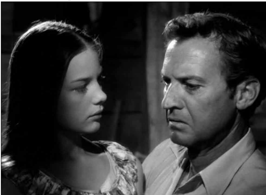
The young one (Luis Buñuel, 1960).