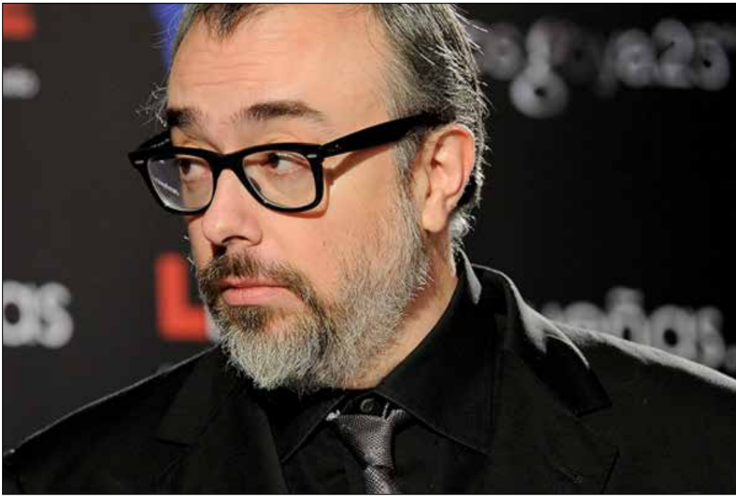
Álex de la Iglesia.

bastante debido a la insistencia y a los trucos del administrador y de los demás vecinos para que no fugue con el dinero. En “Crimen Perfecto” (De la Iglesia, 2004), el suspenso está en el hecho de que Rafael ha matado a su jefe y la única persona que lo sabe es una persona controladora que lo delatará si no la complace en lo que ella quiera; esta situación lleva al espectador a estar todo el tiempo preguntándose: ¿lo delatará o no lo hará? A medida que avanza la acción habrá una vuelta de tuerca: Rafael intentará asesinar a Lourdes planeando cuidadosamente la manera, de tal modo que nadie sepa que fue él (es decir, el crimen perfecto).