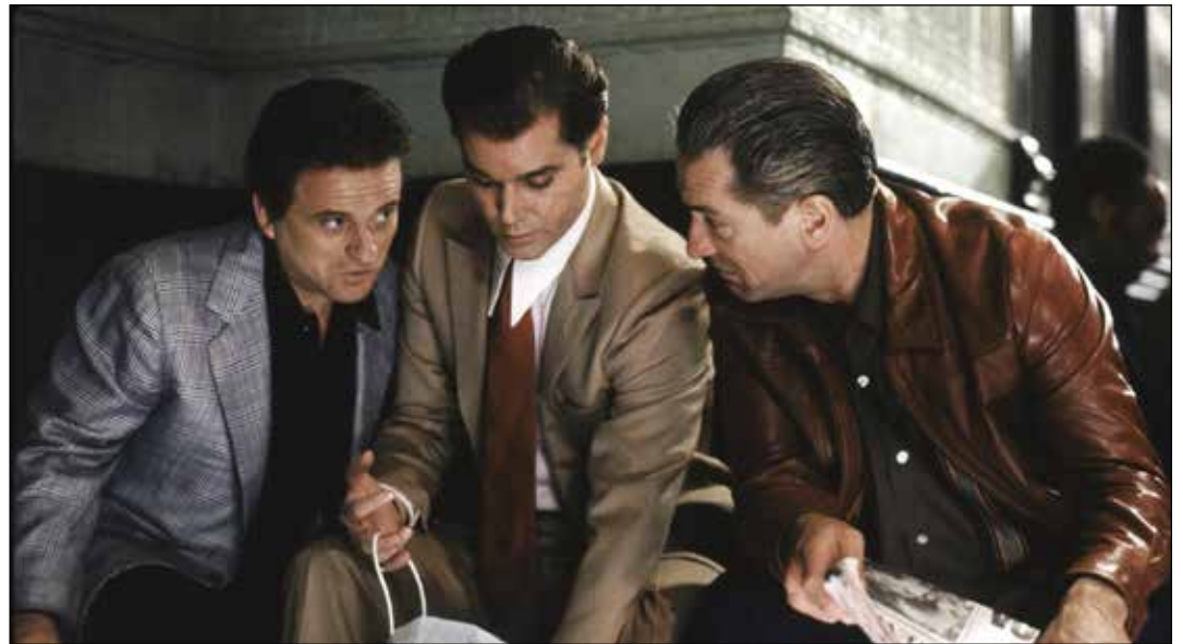
Goodfellas (Martin Scorsese, 1990).

la cabeza de Harvey cae sobre la almohada y suena Be my baby o cuando la pelea en el billar se acompaña con Please, Mr. Postman .