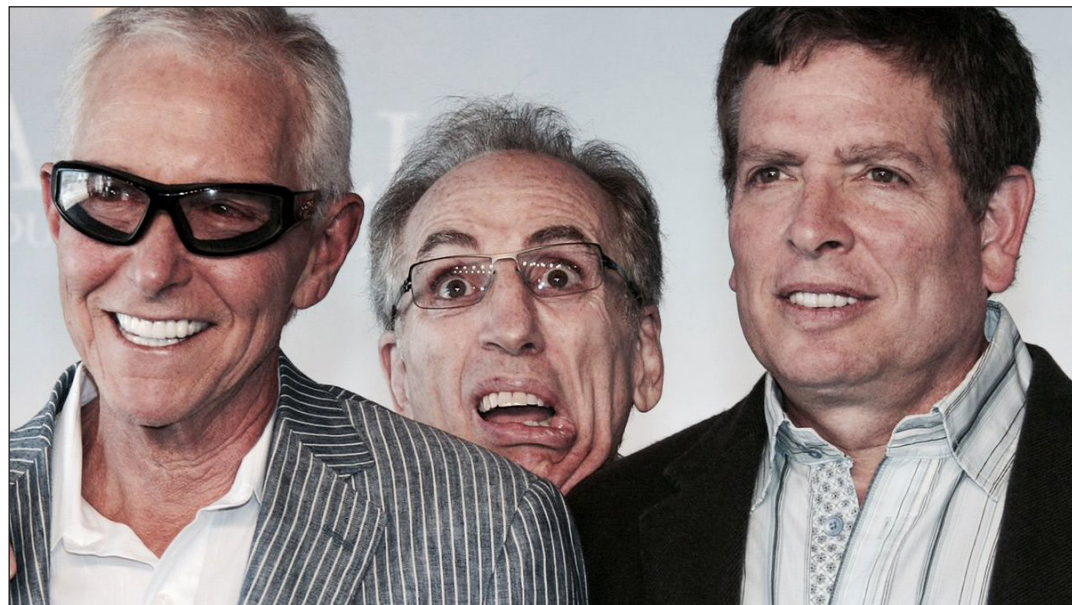
Jim Abrahams, Jerry Zucker y David Zucker.

Es cierto que algunos personajes de Stiller son tontos (indiscutiblemente es el caso del propio Derek Zoolander), pero este tipo de arquetipo es típico en las comedias americanas y, como ya se ha mencionado, el enfoque de ambas propuestas es muy diferente como para considerar una influencia.